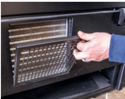
Maschinengitter abnehmbar zur einfachen Reinigung des Kondensators

Großer Aufbewahrungsraum für Backbleche (Seitenansicht)