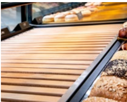
Hochwertiges Holzgitter zur Brotablage, keine sichtbaren Krümel

Die darunterliegende Krümelschublade aus Edelstahl kann herausgezogen und gereinigt werden